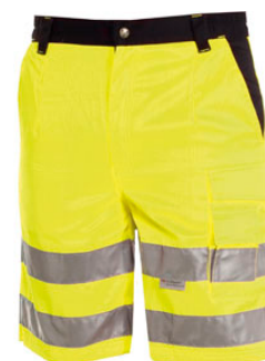
AMARILLO FLUO/AZUL NAVY