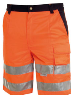
NARANJA FLUO/AZUL NAVY